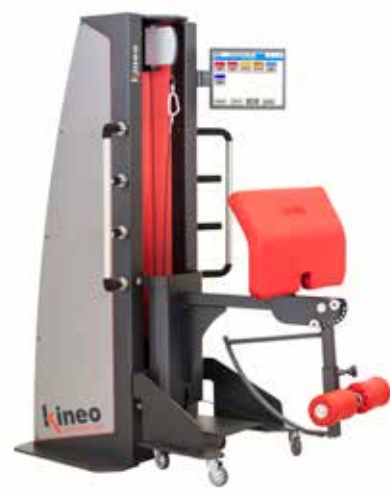
KINEO CURL • LEG CURL