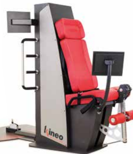
KINEO MULTISTATION • LEG EXTENSION • SQUAT • PULLEY