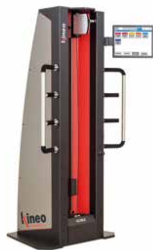
KINEO PULLEY • PULLEY