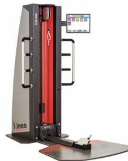
KINEO PULLEY SQUAT • PULLEY • SQUAT