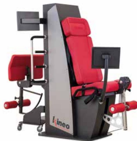
KINEO LEG PRO • LEG EXTENSION • LEG CURL