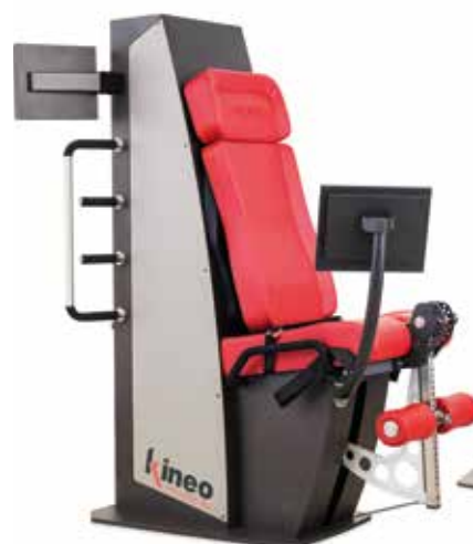
KINEO LEG EXTENSION • LEG EXTENSION